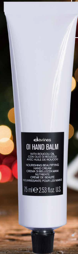
オイ ハンドバーム