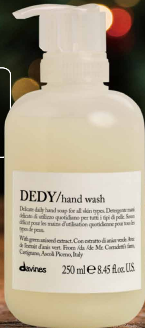
ダヴィネスエッセンシャル デディ ハンドウォッシュ