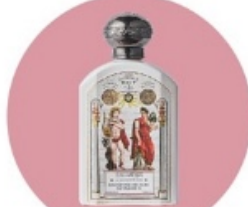
Officine Universelle Buly

センターパートなど、サラッとした髪型のセットに使いやすいです。リモート会議など、ワックスは付けたくないけど、ボサボサにはできない時などいいですね。