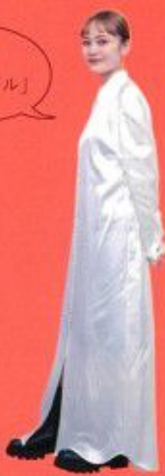
Entry 1 KAORI SCREEN